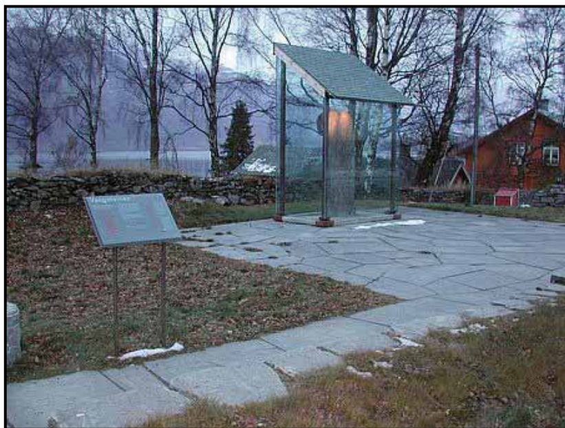
Vangssteinen – tilrettelagt kulturminne – Grindaheim i Vang kommune

I løpet av 2001 og 2003 gjennomførte Fagenhet for kulturvern prosjektet Skilting og tilrettelegging av kulturminner i Oppland, jf. Kulturhistorisk rapport 2004-1. I denne perioden ble det skiltet og tilrettelagt flere kulturminneområder i Oppland, og det ble opparbeidet en større kompetanse på dette området. Viktige produkter fra prosjektet var en mal for skilttype og design av skilttekst, kriterier for god skilting og en mal for skjøtselsplan og skjøtselsavtale som skal lages på alle de stedene fylkeskommunen bidrar. Dette arbeidet gjør at det er nå er raskere og enklere å få tilrettelagt flere kulturminnelokaliteter.