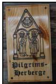
Middelalderloftet på Sygard Grytting i Sør-Fron tjener som pilegrimsherberge

Av satsinger og tiltak som inngår i pilotarbeidet er følgende ført opp ut fra regionale prioriteringer (gjennomføringen blir styrt av egne planer for de geografiske innsatsområdene Valdres og Nord-Gudbrandsdalen og for Pilegrimsleden):