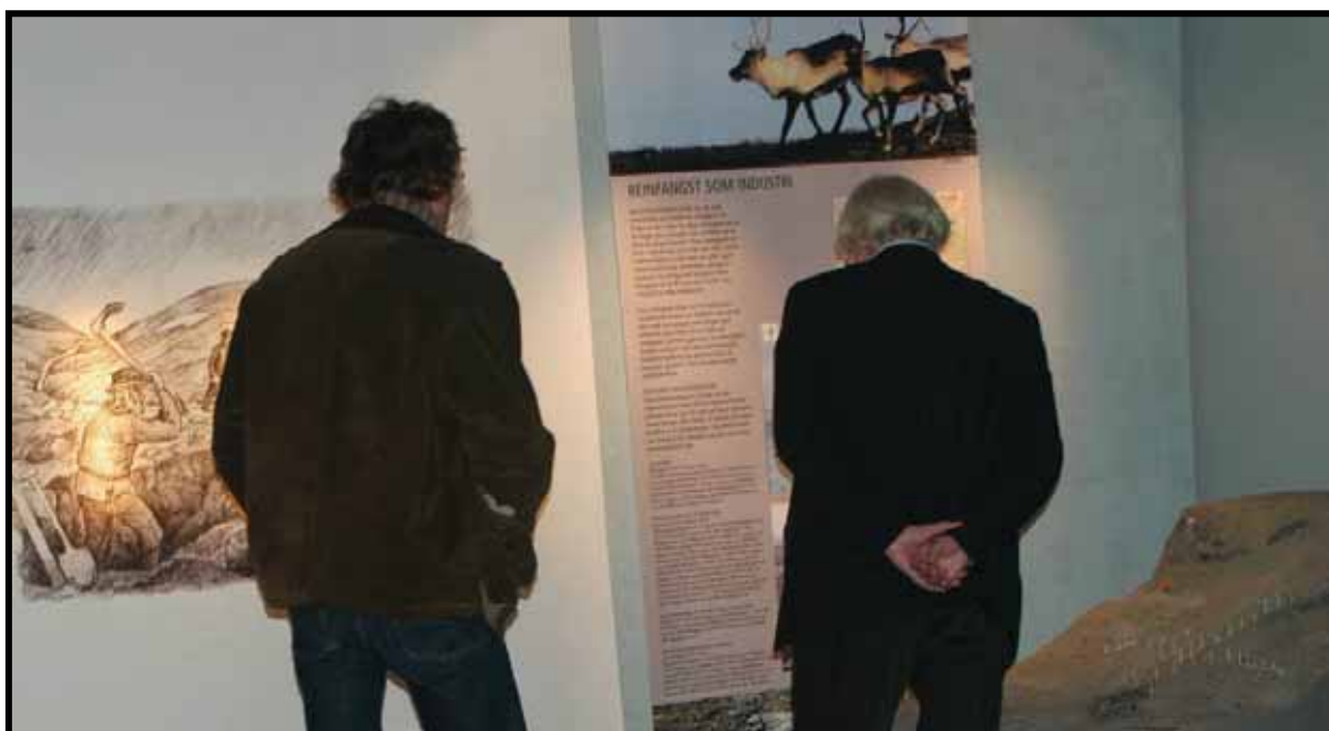
Fra villreinutstillingen ved Lesja bygdemuseum – avdeling av Museet i Nord-Gudbrandsdalen

IKT er gjennom samarbeid mellom museene utviklet til et avansert hjelpemiddel. Musenes samlinger/dokumentasjon er godt registrert og tilgjengelig for publikum.