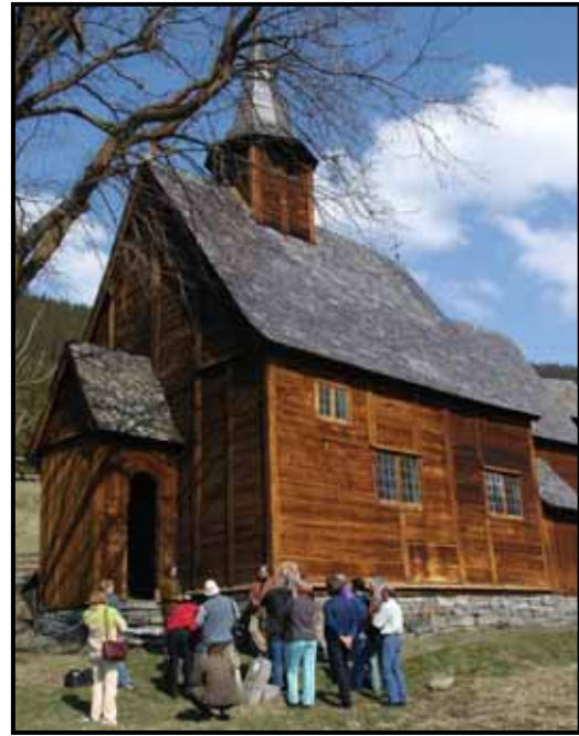
Lomen stavkirke

I oppfølging og gjennomføring vil fylkeskommunen blant annet forplikte seg til å støtte opp om arbeidet med: