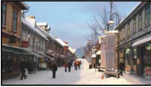
Storgata i Lillehammer

I oppfølging og gjennomføring vil fylkeskommunen blant annet forplikte seg til å støtte opp om arbeidet med: