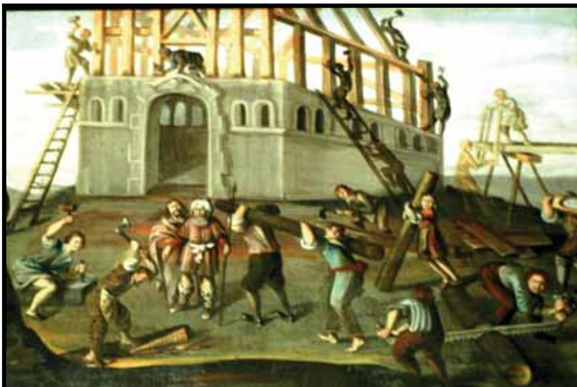
Bygningsarbeid på 1600-tallet. Fra maleri i Kvernes stavkirke

Regjeringen har de siste årene økt bevilgningen til istandsetting av fredete kulturminner. Økningen kommer som følge av Stortingets behandling av Stortingsmelding nr. 16 "Leve med kulturminner". Meldingen inneholder en opptrappingsplan der intensjonen er at budsjettet skal øke årlig fram mot 2009. Med dette forutsetter Stortinget at alle kulturminner skal ha vanlig vedlikeholdstilstand innen 2020. Forutsetningen for tildeling av midler er at det er gjennomført systematiske tilstandsanalyser av alle de privateide fredete bygninger. Oppland avslutter sitt arbeid med analysen på nyåret 2007. Siden Oppland har så mange som ca. 500 fredete bygninger i privat eie, forventes en storstilt økonomisk satsing gjennom tilskudd til eiere som ønsker å gå i gang med istandsetting.