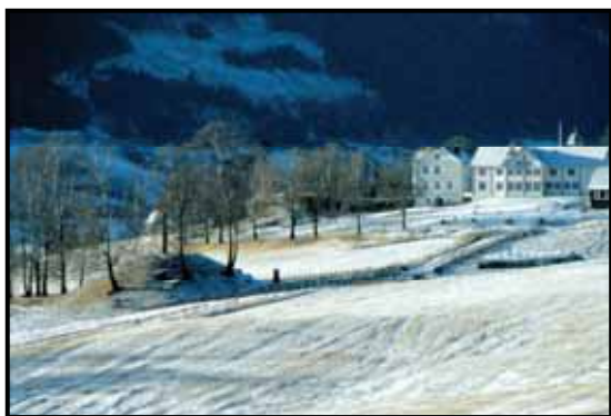
Hundorp Dale-Gudbrands gard

I oppfølging og gjennomføring vil fylkeskommunen blant annet forplikte seg til å støtte opp om arbeidet med: