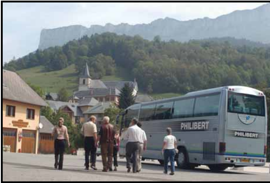
Fylkespolitikere fra Oppland på besøk i Chartreuse regionale naturpark i Frankrike for å studere verdiskaping med grunnlag i natur- og kulturarven.