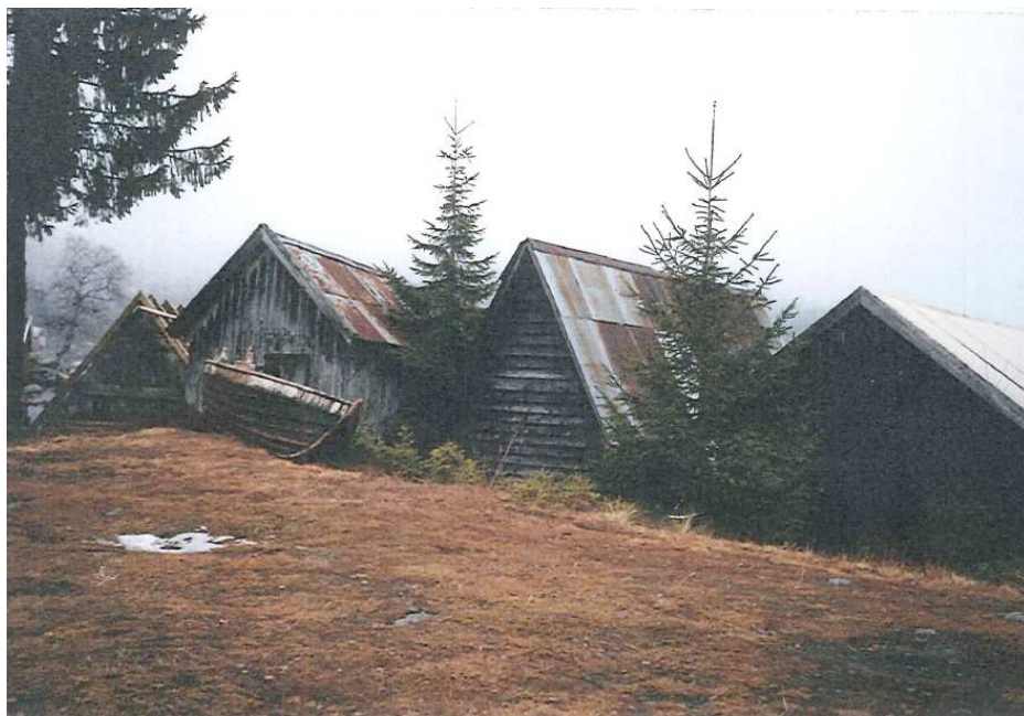
Bilder fra kulturmiljøet på Sagvolden ved Steinsjøen

Konsekvensutredningen sier følgende: En evt. utbygging må ta hensyn til det særegne kulturmiljøet på Sagvolden (naboområdet) og at det kan bli mulig eksponering mot Sagvolden. Viktig skiløype / tursti går gjennom området. Det er tidligere registrert storfugleik i nærheten. Veg har begrenset kapasitet og vann og avløp anbefales ikke.