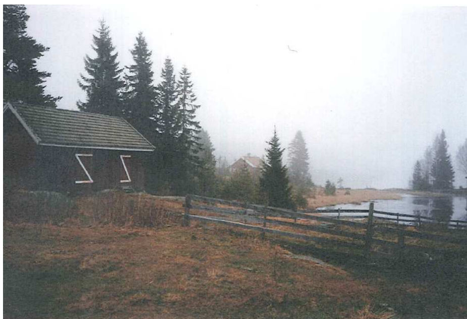
Bilder fra kulturmiljøet på Sagvolden ved Steinsjøen