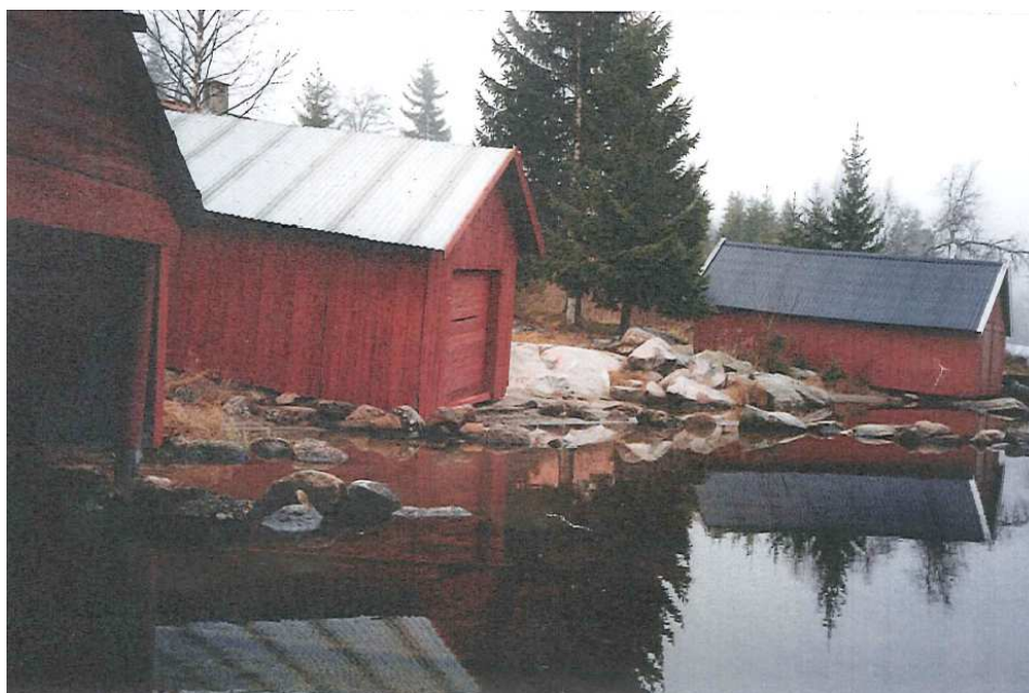
Bilder fra kulturmiljøet på Sagvolden ved Steinsjøen

Fylkesrådmannen mener konsekvensutredningen viser at utbygging i dette området vil ha store negative konsekvenser for bla friluftslivet. En utbygging i området vil ta hull på et forholdsvis urørt område og vil legge press på arealer i et attraktivt område for friluftsliv. Området ligger i sin helhet innenfor hensynssone for Øståsen for friluftsliv med regional betydning. I kommuneplanens retningslinjer for Øståsen er det spesifisert at det skal legges særlig vekt på hensynet til friluftsliv, og fylkesrådmannen kan ikke se at dette ivaretas ved større utbygging av hytter. Det er i planforslaget avsatt et stort byggeområde for fritidsbebyggelse på Lygna, øst i kommunen, og vi mener behovet for nye hyttetomter med det er dekket for mange år framover. I området med ved Steinsjøen er det et spesielt miljø med små, enkle bygninger med høy verneverdi, Sagvolden. Dette området er ikke befar. Fylkesrådmannen anbefaler på bakgrunn av dette å fremme innsigelse til området H Steinsjøen.