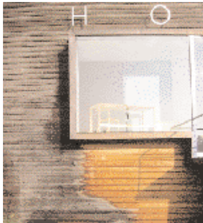
Forretningsbygg, Bayern, Tyskland

Ønskes en jevn farging av vegg, må utspring helst unngås. Eventuelt kan takutspring være så stort at vegg ikke får nedbør.