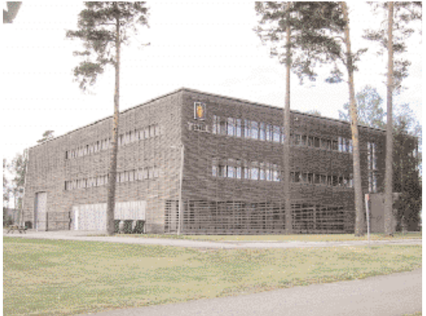
Oslo og Akershus tolldistrikt, Gardermoen