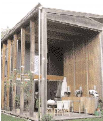
Enebolig, Salzburg, Østerrike

Når man har erfaring, kan man forutsi temmelig nøyaktig hvordan en værpåvirket fasade vil ta seg ut etter 10 år, alt avhengig av høyde over havet, klimaforhold og værpåvirkning. Man må dog ta mikroklimaet rundt huset i betraktning. For eksempel er det viktig å analysere hvilken innflytelse store trær rundt bygningen og detaljering i fasaden vil kunne få på utviklingen av fargeendringer.