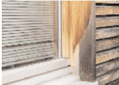
Barnehage, Bregenz, Østerrike