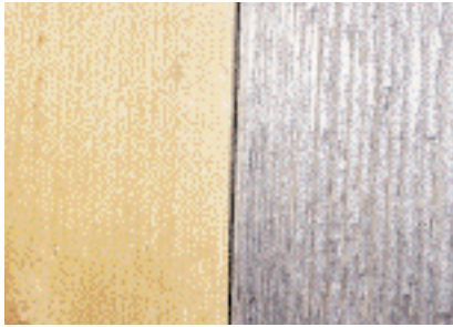
Ueksponert og eksponert flate (etter 20 uker).

De delene av en veggflate som er mest eksponert for fuktighet, gråner raskest. En jevn, grå farge kan sommerstid opptre allerede etter 3-4 uker. Etter videre eksponering mørkner fargen, slik at den etter 3-4 måneder er mer kraftig. I den diffusjonsåpne overflaten kan vann raskt både trekke inn og tørke ut. Dette fører til store begrensninger i muligheten for etablering og vekst av råtesopp og treskadeinsekter. Resultatet er at selv etter meget lang eksponering, dvs. flere hundre år, skjer det lite annen aktivitet enn vekst av svertesopp.