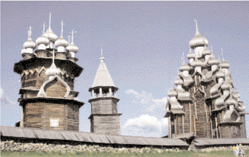
Kizhi, Russland: Furu, gran og osp.