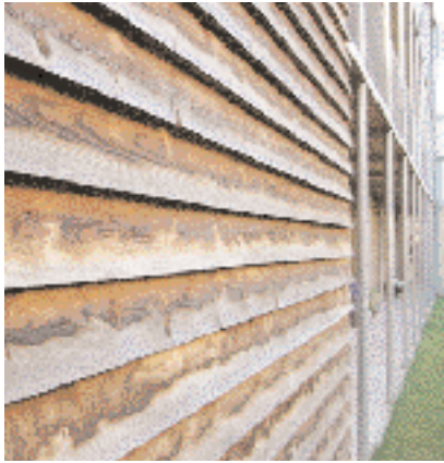
Boligkompleks, Bergenz, Østerrike

Stående kledning vil gi en jevnere farge på veggen enn liggende kledning der bordene overlapper hverandre. Liggende kledning blir jevnest farget om den er helt slett.