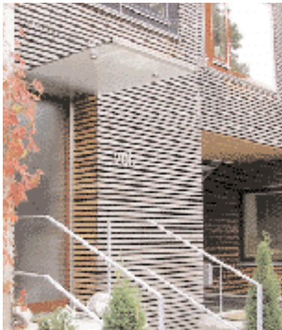
Bolig, Salzburg, Østerrike